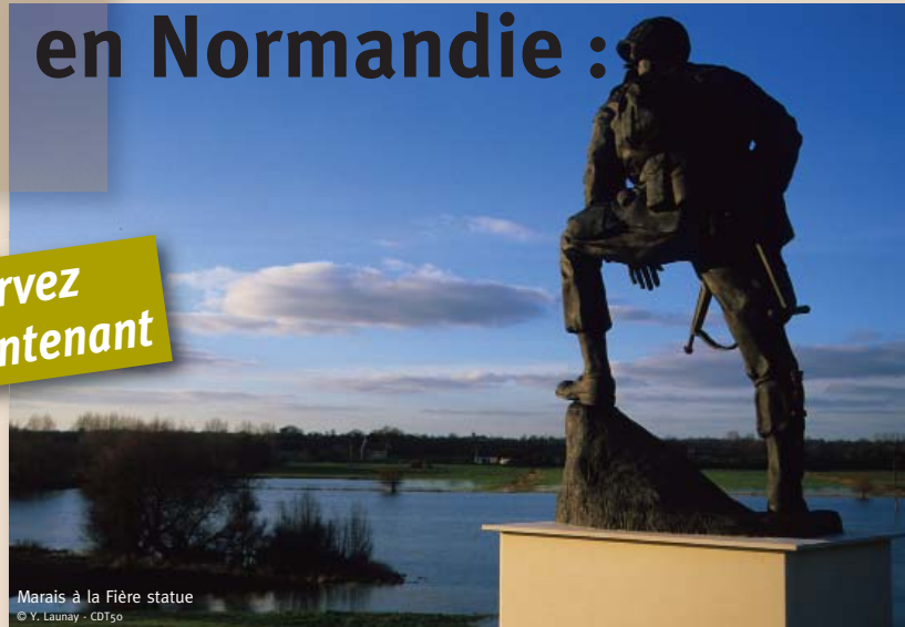
Marais à la Fièvre statue