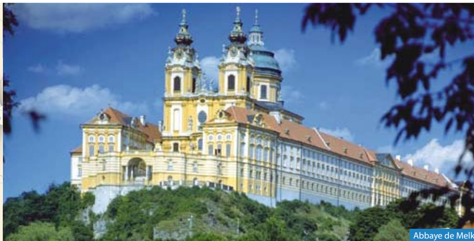
Abbaye de Melk