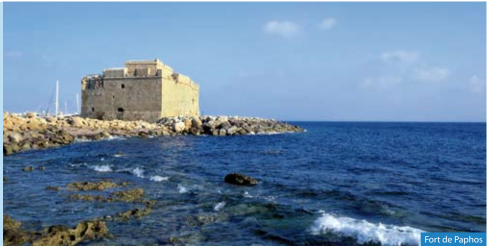
Fort de Paphos