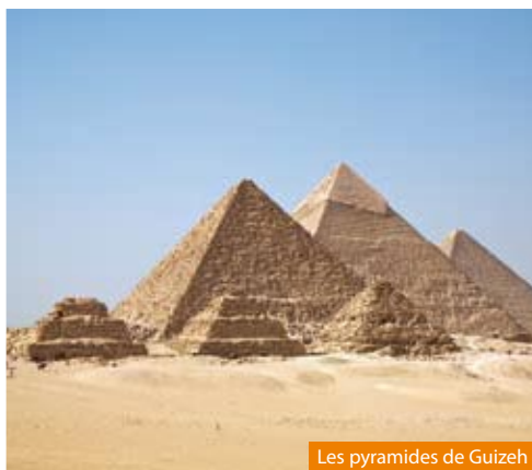
Les pyramides de Guizeh