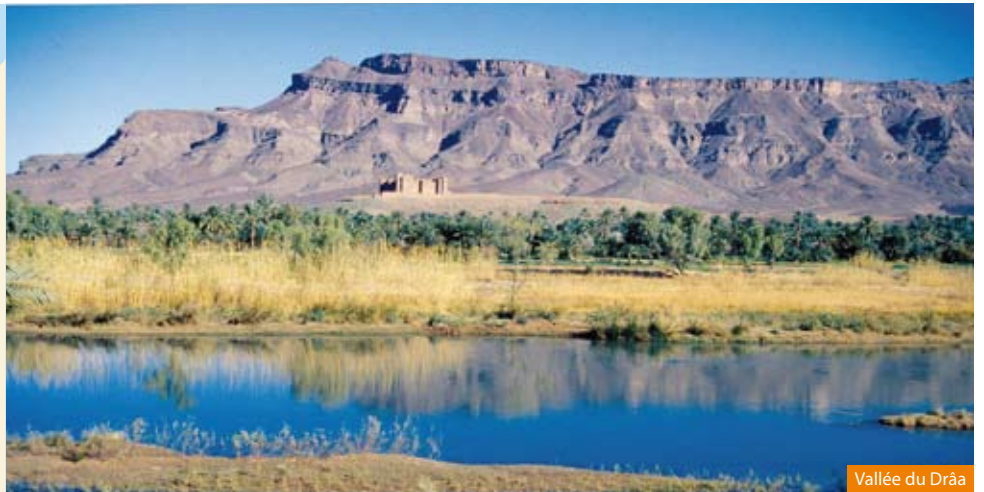
Vallée du Drâa