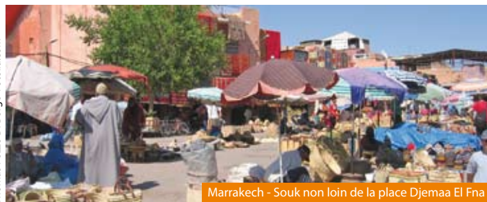
Marrakech - Souk non loin de la place Djemaa El Fna

NOS PRIX COMPRENNENT : Le transfert aéroport si souscrit - Le transport aérien aller-retour sur vols spéciaux - Les taxes aériennes (70 € à ce jour) - Les transferts aéroport/hôtel/aéroport - L'hébergement en chambre double sur la base d'hôtels 3/4* - La pension complète du petit-déjeuner du 2e jour au petit-déjeuner du 8e jour - Les visites et excursions mentionnées au programme - Les services d'un guide accompagnateur francophone pendant toute la durée du circuit - L'assistance rapatriement