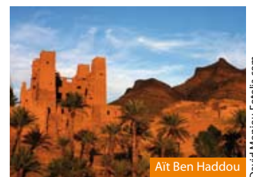
Aït Ben Haddou