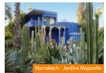
Marrakech - Jardins Majorelle

Transfert à l'aéroport. Vol vers la France . Retour dans votre région, si transfert souscrit.