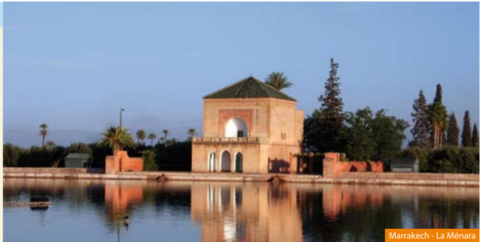
Marrakech - La Ménara