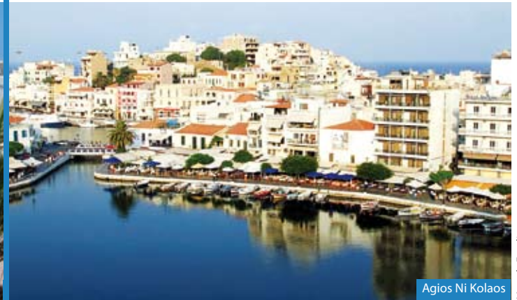
Agios Ni Kolaos