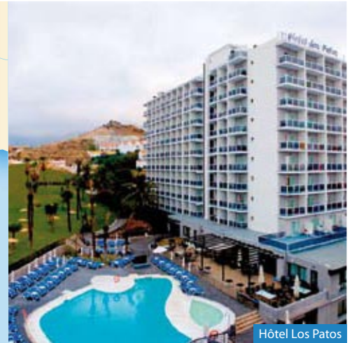
Hôtel Los Patos