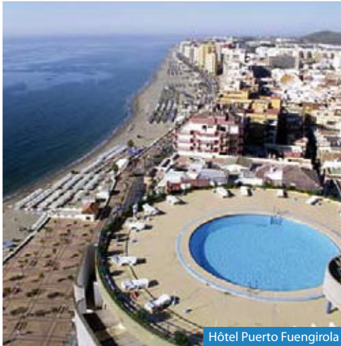
Hôtel Puerto Fuengirola