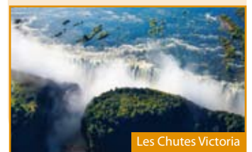
Les Chutes Victoria

Petit-déjeuner à bord. Arrivée en France. Retour dans votre région si transfert souscrit.