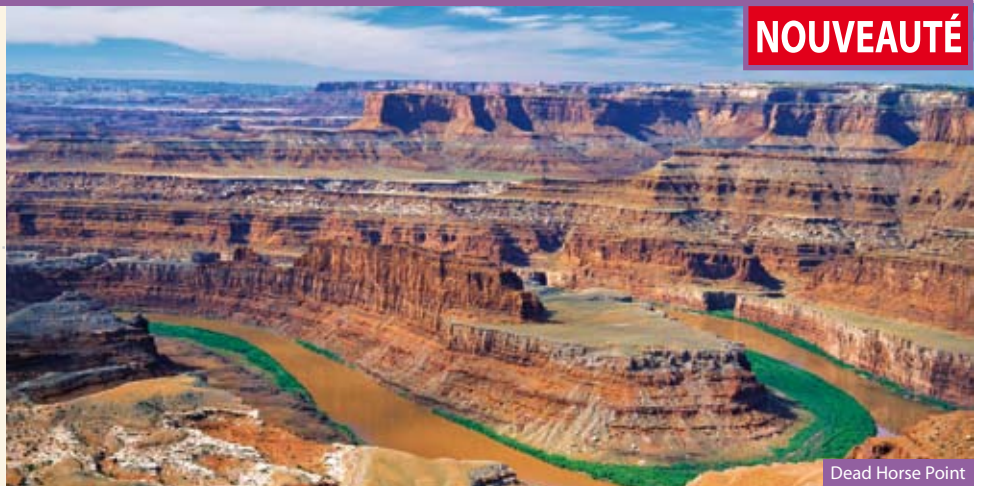
Dead Horse Point