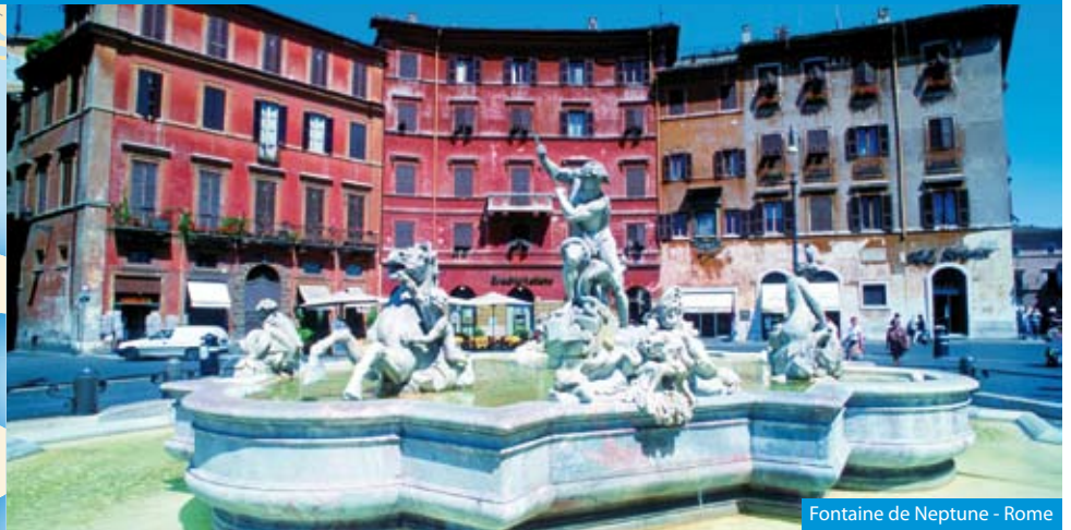
Fontaine de Neptune - Rome