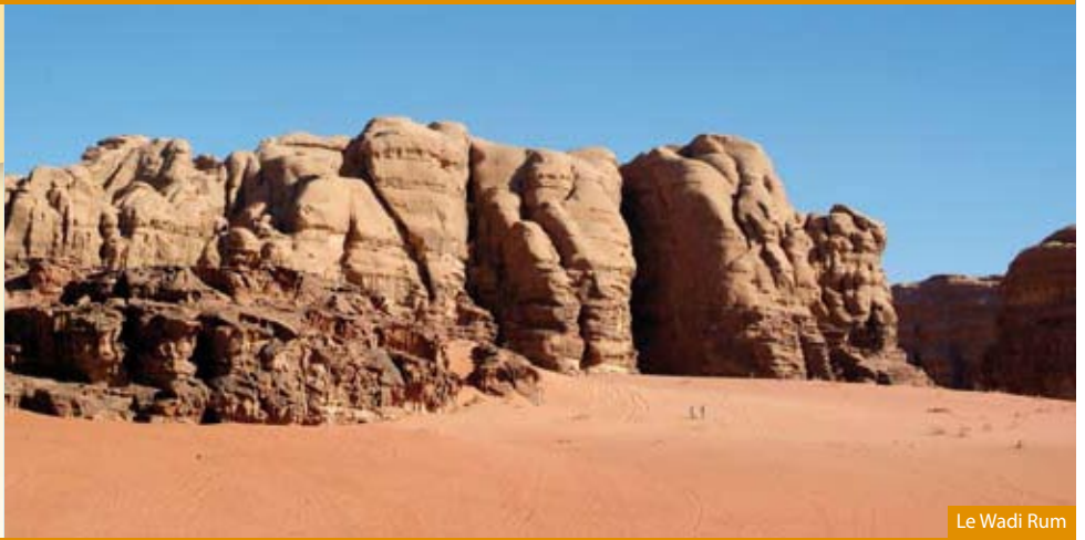
Le Wadi Rum