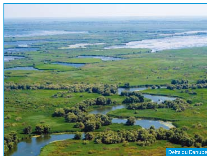
Delta du Danube

Selon l'horaire de vol, continuation de la visite de Bucarest avec la visite du Palais du Parlement. Puis départ vers l'aéroport de Bucarest. Vol pour la France . Arrivée, retour dans votre région si transfert souscrit.