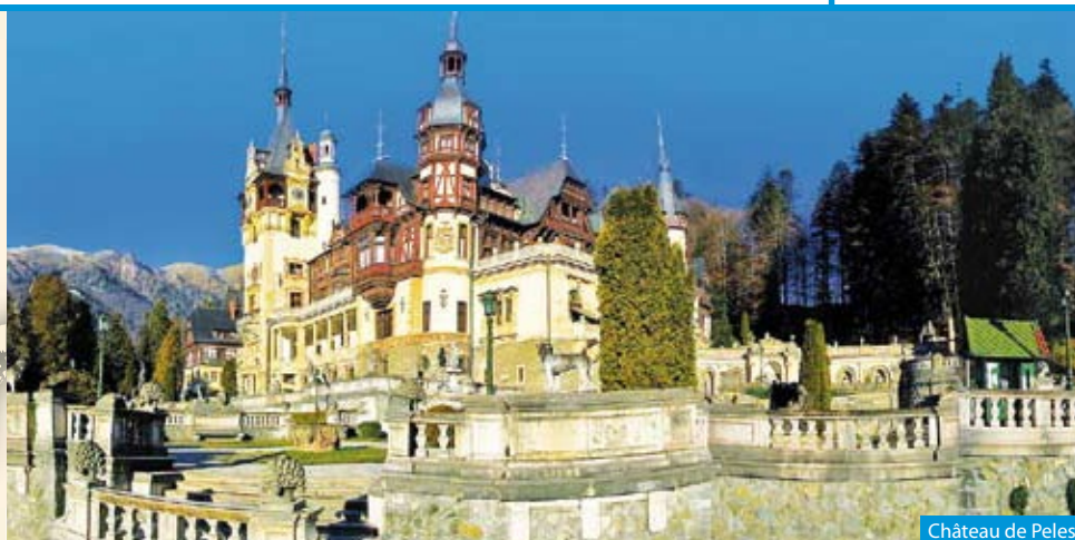
Château de Peles