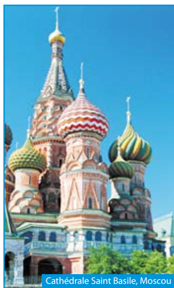
Cathédrale Saint Basile, Moscou

Départ de votre région si transfert souscrit, sinon rendez-vous à l'aéroport. Vol pour Saint-Pétersbourg . Accueil et transfert à l'hôtel. ✈