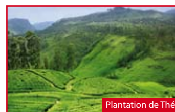
Plantation de Thé

Petit déjeuner à bord. Arrivée à Paris et retour dans votre région si transfert souscrit.