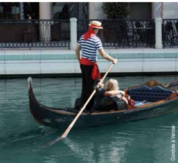
Gondole à Venise