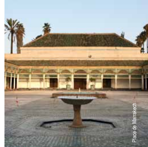
Place de Marrakech