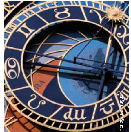
Horloge de Prague

NB : Selon les dates, le circuit peut être effectué en sens inverse et peut se faire indifféremment avec 4 nuits en Bohême du Sud et 3 nuits à Prague ou 4 nuits à Prague et 3 nuits en Bohême du Sud