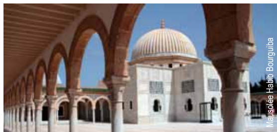
Mausolée Habib Bourguiba