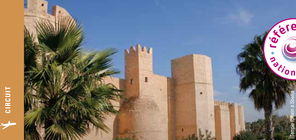
Temple romain à Sbeitla