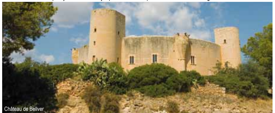
Château de Bellver

Transferts à l'aéroport. Vol vers votre aéroport de départ. Retour dans votre région en autocar.