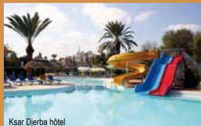
Ksar Djerba hôtel

Bar central, barbecue à la piscine, bar-piscine, bar-plage, café maure, salle de télévision, coin Internet, boutique.